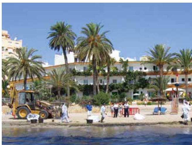
▲ 図17:観光客専用ビーチの防除作業はその地域を訪れる観光客全体の数に影響を及ぼし、多くの事業による純粋経済損失の求償につながる可能性がある。

求償に関して共通点の多い課題に重点を置き、その中でも特に漁業と養殖業の求償に焦点を合わせている。