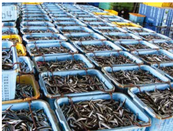
▲ 図19:魚市場で水揚げされ、販売される魚。詳細な販売数量が分かれば、油流出によって生じた損失の求償査定に役立つ。

零細漁業(図18)は日々の食料または物々交換のための海産物の確保に重点を置いており、金銭のやりとりが発生しない場合がある。これらの要因が重なることによって多くの漁業の求償の査定が困難になる。漁師の多くは日々の仕事を口頭で報告する以外に求償を裏付ける証拠書類を持ち合わせていないからである。このような場合には、請求者、選任された専門家(ITOPFを含む)、地方自治体、漁業取締官、そしてその他の関係者が一丸となって、油流出期間中の漁業の実際の財政状態を描き出すことが重要になる。この作業は大がかりな現地調査と情報収集を必要とし、長期にわたる可能性がある。小規模な観光事業やその他の事業の場合も同様のアプローチが必要になるかもしれない。