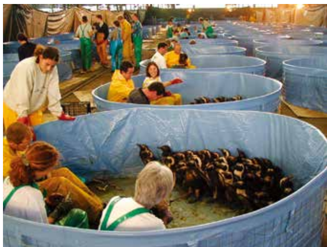
▲ 図8: 野生生物の洗浄およびリハビリは多額の求償を生む可能性がある。費用には施設の暖房や照明、作業員のための保護衣、鳥の餌などが含まれることがある。

人員、そして対応に使用する多くの資機材は移動性が高く、1日の内に複数の現場の間を移動するかもしれない。例えば、作業員は潮の干満に合わせてさまざまな業務に配備されることがあり、廃棄物入れコンテナは海岸線と廃棄物貯蔵庫または廃棄物処理場の間を繰り返し往復するかもしれない。広域または長距離にわたる事故の場合、特定の資源にコードま