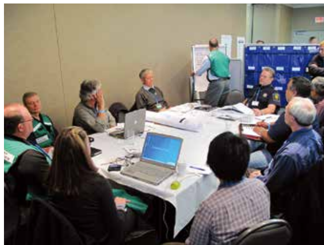
▲ 図5:対応オプションについて議論し決定するために開催したあらゆる会議の議事録は、求償を裏付ける証拠書類に含めるべきである。

情報は対応において効果的な管理、指揮、統率の鍵となる。事故の最初の通知以降、指定された連絡窓口には一般の人々や現場で作業中の対応チーム、外部機関など非常に多くの情報源から情報が集まってくる。こうした情報は後日参照できるように、論理的かつ系統的に記録するための手順を定めておかなければならない。最低でも入手した日時と情報源は記しておく