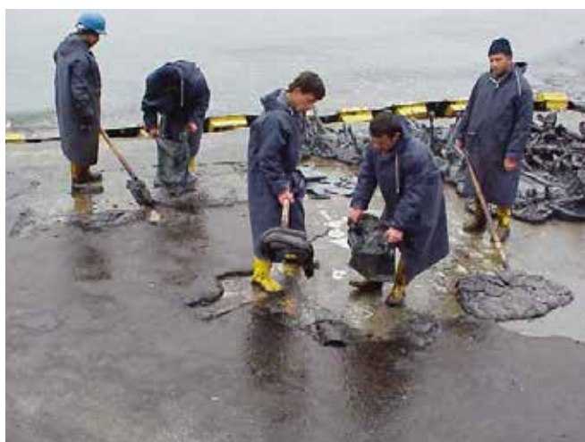
▲ 図3と図4: 大きな労働力を要する防除費用の求償と、漁業に関連する損失の求償の裏付けには、異なる種類の証拠書類を必要とする。

補償金を支払う機関は必要に応じ現地に担当者を送ることになる。多くの場合、この担当者は保険業者の地元代理店または地元の調査会社から派遣される。国や地域によっては、それ以外に例えば油流出管理チームのような組織も駆り集められることになる。また、保険業者またはIOPC基金は、汚染対応に関わる人々や事故の影響を受けている人々に助言をするために、ITOPFなどの専門家を選任することもある。しかし、専門家の助言は補償金を決定する者に対して拘束力を持たないことに留意する必要がある。