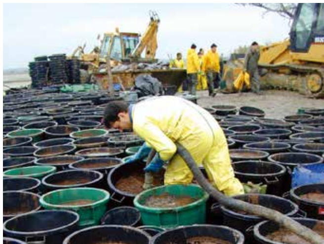
▲ 図14: 廃棄物の取り扱い、貯蔵、輸送、処理および処分には費用がかかりがちである。回収、移動および処理する廃棄物量の記録には特別な注意を払う必要がある。