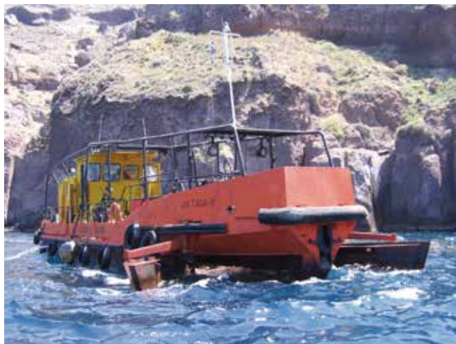
▲ 図12:特殊な対応船舶の使用に係る費用は、船舶の運航費に基づき、必要に応じ一定の利益を許容し算出するべきである。

価を下げて保守整備費用と運営費のみとすべきであり、必要に応じ利益を上乗せする。利用期間が伸びるに従い削減する固定費を反映するには、特定の利用期間経過後は一定の間隔で段階的に単価を下げると良い。求償には、資機材の取扱説明書または仕様書を添付すること。