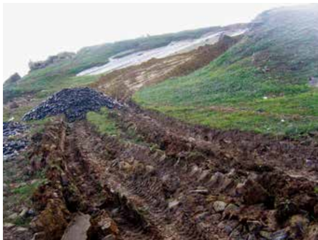
▲ 図15:油で汚染された海岸線に重機が行き来することで激しく損傷した野原。野原の回復費用を求償する場合、正確な損傷の度合いと回復作業による原状回復以上の可能性を確認するために調査を行う必要が生じる。