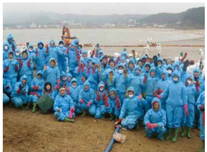
▲ 図13: 対応活動に大勢のボランティアが参加する場合、保護衣や食料、宿泊施設などを提供するために相当な費用がかかることがある。

対応における消耗品または購入品の使用目的、使用された日付と場所、そして買い取り価格はすべて記録する必要がある。大量購入品、特に吸着材やPPEなどの使用状況を、中央倉庫から現地の配送区域、そして特定の作業現場または船舶まで追跡することは難しい。特に、大規模事故対応における緊急対応段階では困難である。そのため、正確さを確保するためには、この仕事に経験豊富な実務担当者を割り当てる必要がある。発注書や製品在庫譲渡証明書、在庫報告書、請求明細書、領収書などは適切に保管し索引を付けておくべきである。また、燃料の領収書には対応に使用したどの船舶、車両または資機材のために購入したものかを特定できるよう注釈を付ける必要がある。