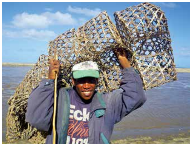
▲ 図18:生活権漁業の場合、求償を裏付けるために必要な財務記録を有していないことが多い。そのため、損失を確定するためにそれ以外の方法や情報源を用いることがある。