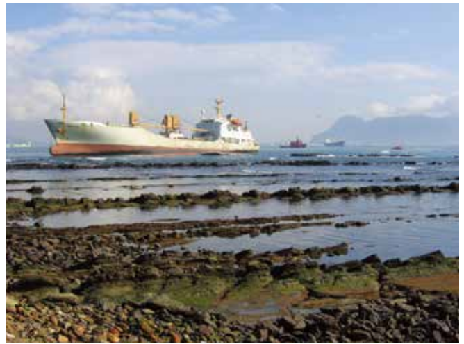
▲ 図1: 船から油流出が起きると、被った損失に対し適用される法体制によって、いくつかある支払元のいずれかから補償金が支払われる可能性がある。