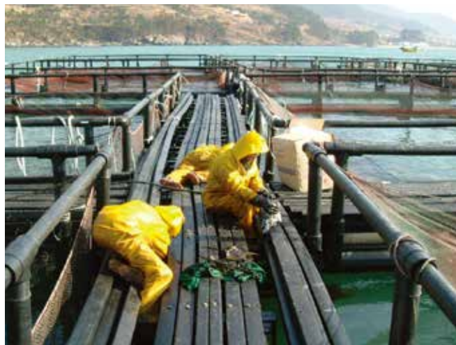
▲ 図16:油で汚染された生け簀(いけす)を洗浄している様子。油汚染の結果生じたあらゆる収益減は派生経済損失の求償につながる可能性がある。