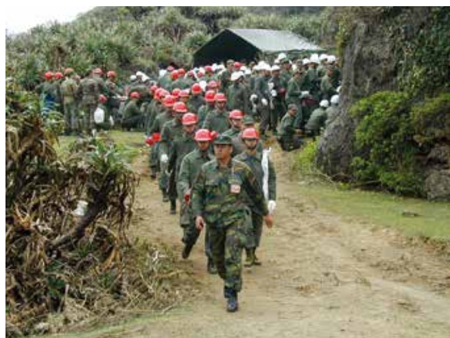
▲ 図9: 海岸線の清掃を支援するために動員された軍事要員。彼らの参画に関連する費用の求償は、陸軍が直接行うか、政府機関がより広範な求償の一部として行うことがある。

費用の記載漏れまたは重複が発生しないようにするためには、求償を準備する際にきちんと整理し調整することが重要となる。事例によっては、リーダー的立場の団体が他の団体や個人の求償を取り込み、一本化して請求することを選択する場合がある(図9)。この方法は求償の査定を担当する者にとっては