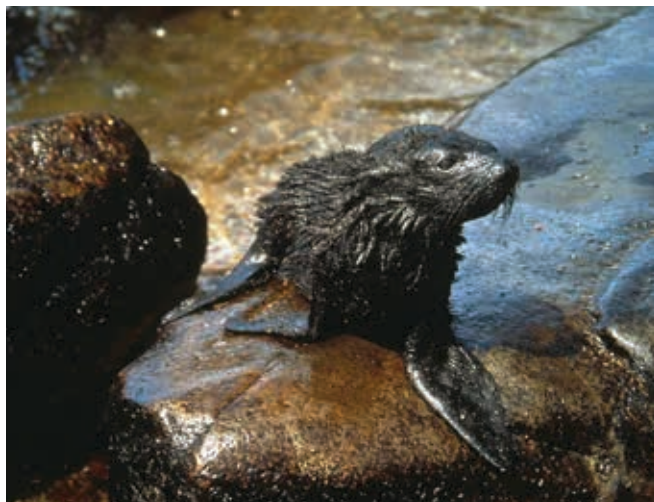
▲ Figura 5: Los hidrocarburos pueden perjudicar la capacidad de los mamíferos, como por ejemplo esta cría de foca (Arctocephalus australis), de mantener funciones fisiológicas vitales.

mortalidades, generalmente las necropsias han concluido que las causas de la muerte no guardaban relación con los hidrocarburos. Aunque también podría esperarse que grandes mamíferos marinos tropicales, como por ejemplo los sirenios herbívoros (manatíes y dugongos), fueran vulnerables, los informes de daños por contaminación para estos animales son muy inusuales. No obstante, las focas, nutrias y otros mamíferos marinos que se encaraman o pasan tiempo en la costa tienen más posibilidades de encontrar y padecer los efectos de los hidrocarburos. Las especies que dependen del pelaje para regular su temperatura corporal son las más vulnerables a los hidrocarburos, ya que los animales podrían morir de hipotermia o sobrecalentamiento, según la estación, si el pelaje quedara apelmazado por los hidrocarburos ( Figura 5 ).