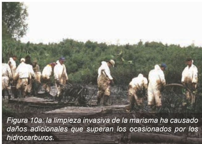
Figura 10a: la limpieza invasiva de la marisma ha causado daños adicionales que superan los ocasionados por los hidrocarburos.