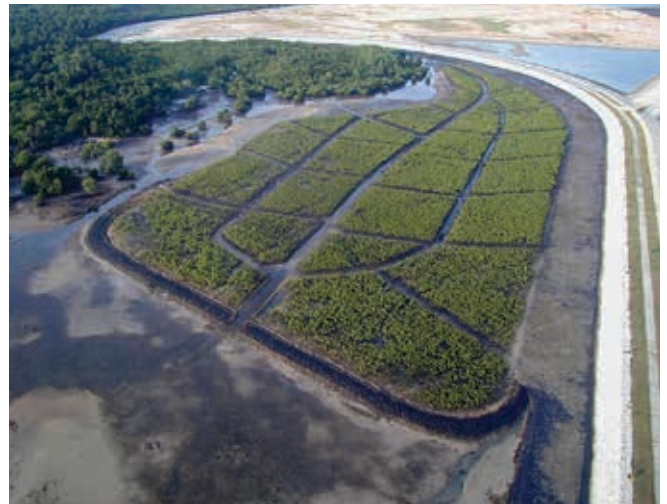
▲ Figura 11: una zona de manglar, creada a partir de la plantación de plántulas individuales en un patrón reticular.

El diseño de estrategias de restauración coherentes para la fauna plantea un desafío mucho más complejo. Puede decidirse la protección de los hábitats dañados y podría mejorarse la recuperación de los ecosistemas, por ejemplo, mediante la limitación del acceso y la actividad humana, el establecimiento de controles a la pesca para reducir la competencia por una fuente de alimento limitada, como en el caso de anguilas y frailecillos comunes, o el cierre de playas utilizadas por tortugas durante la época de nidificación. En