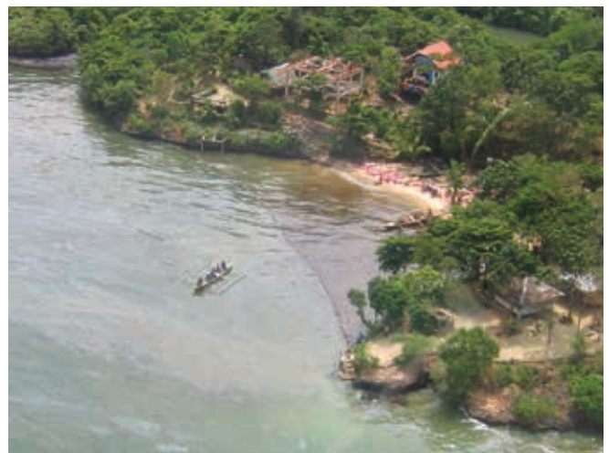
▲ Figura 1: hidrocarburos varados en la costa adyacente a una población pesquera.