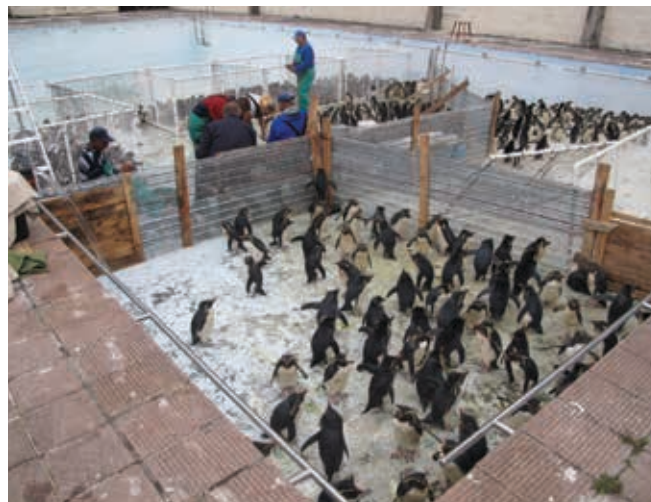
▲ Figura 4: los pingüinos responden mejor que otras especies de aves a la limpieza. En la imagen, pingüinos de penacho amarillo (Eudyptes moseleyi) en rehabilitación.

condiciones de tormenta, con la liberación de cantidades considerables de hidrocarburos ligeros en la rompiente a lo largo de una franja costera, o con derrames en ríos. El impacto de los derrames de hidrocarburos en las poblaciones de peces en explotación y productos marinos cultivados se consideran con más detalle en el documento de ITOFF Efectos de la contaminación por hidrocarburos en la industria pesquera y maricultura.