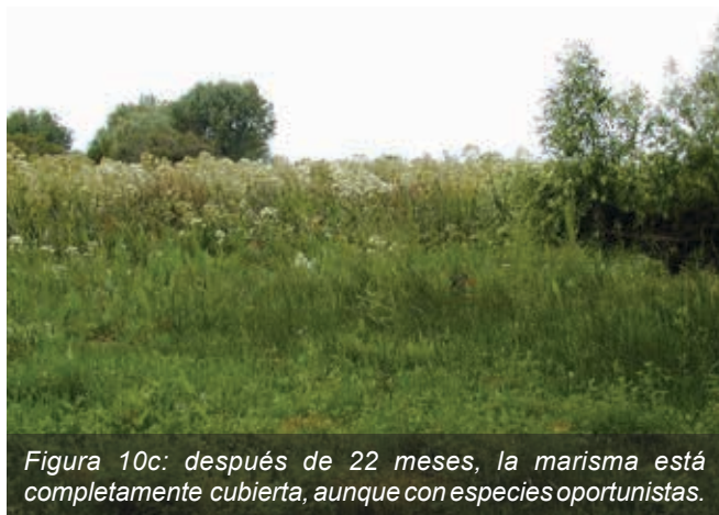
Figura 10c: después de 22 meses, la marisma está completamente cubierta, aunque con especies oportunistas.