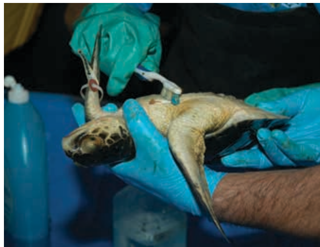
▲ Figura 6: limpieza de un ejemplar joven de tortuga carey (Eretmochelys imbricata).

En aguas templadas y tropicales prosperan diferentes