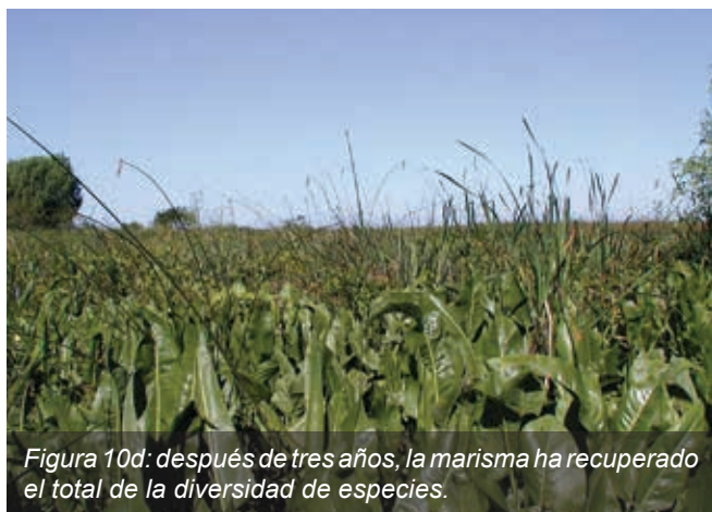
Figura 10d: después de tres años, la marisma ha recuperado el total de la diversidad de especies.