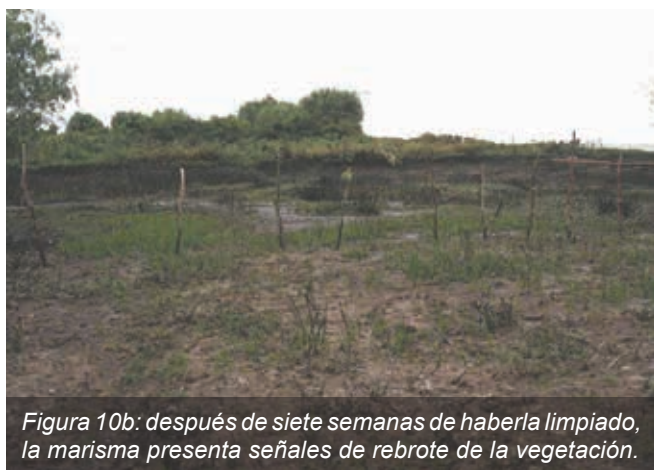
Figura 10b: después de siete semanas de haberla limpiado, la marisma presenta señales de rebrote de la vegetación.