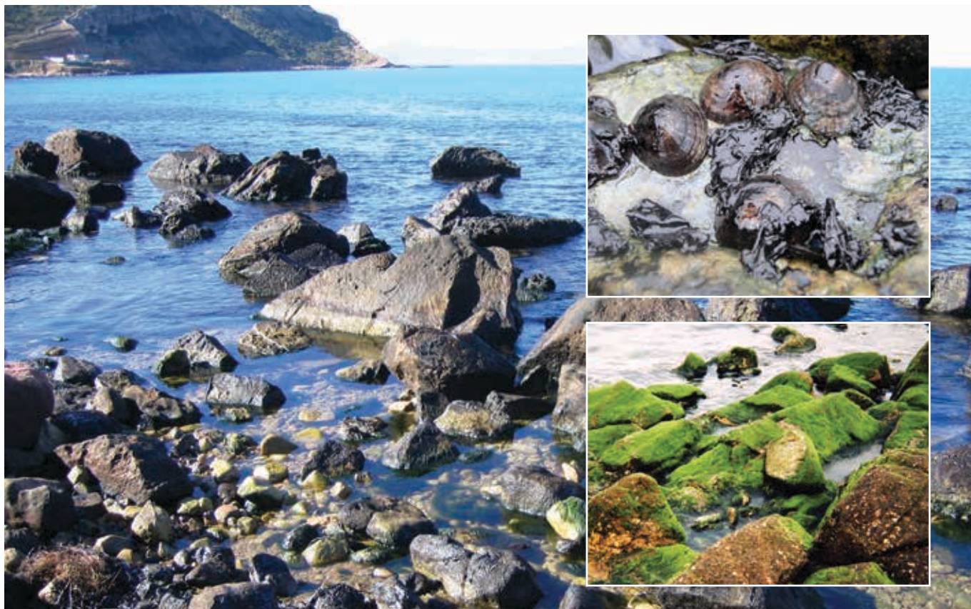
▲ Figura 7: las costas rocosas normalmente están expuestas al viento y al oleaje y pueden limpiarse con rapidez. Los hidrocarburos pueden afectar la biota, incluidas las lapas. Una mortalidad considerable podría provocar la abundancia posterior de flora oportunista (algas y algas marinas) que normalmente se mantendrían controladas al servir de alimento para las especies desaparecidas. Las especies volverán a establecerse y el equilibrio se restaurará con el tiempo.

Las arenas finas y el lodo se encuentran en zonas protegidas de la acción del oleaje, incluidos los estuarios, y suelen ser muy productivos biológicamente (Figura 8). A menudo albergan grandes poblaciones de aves migratorias e invertebrados autóctonos que habitan en los sedimentos, incluidos los bivalvos, y también son zonas de cría para algunas especies.