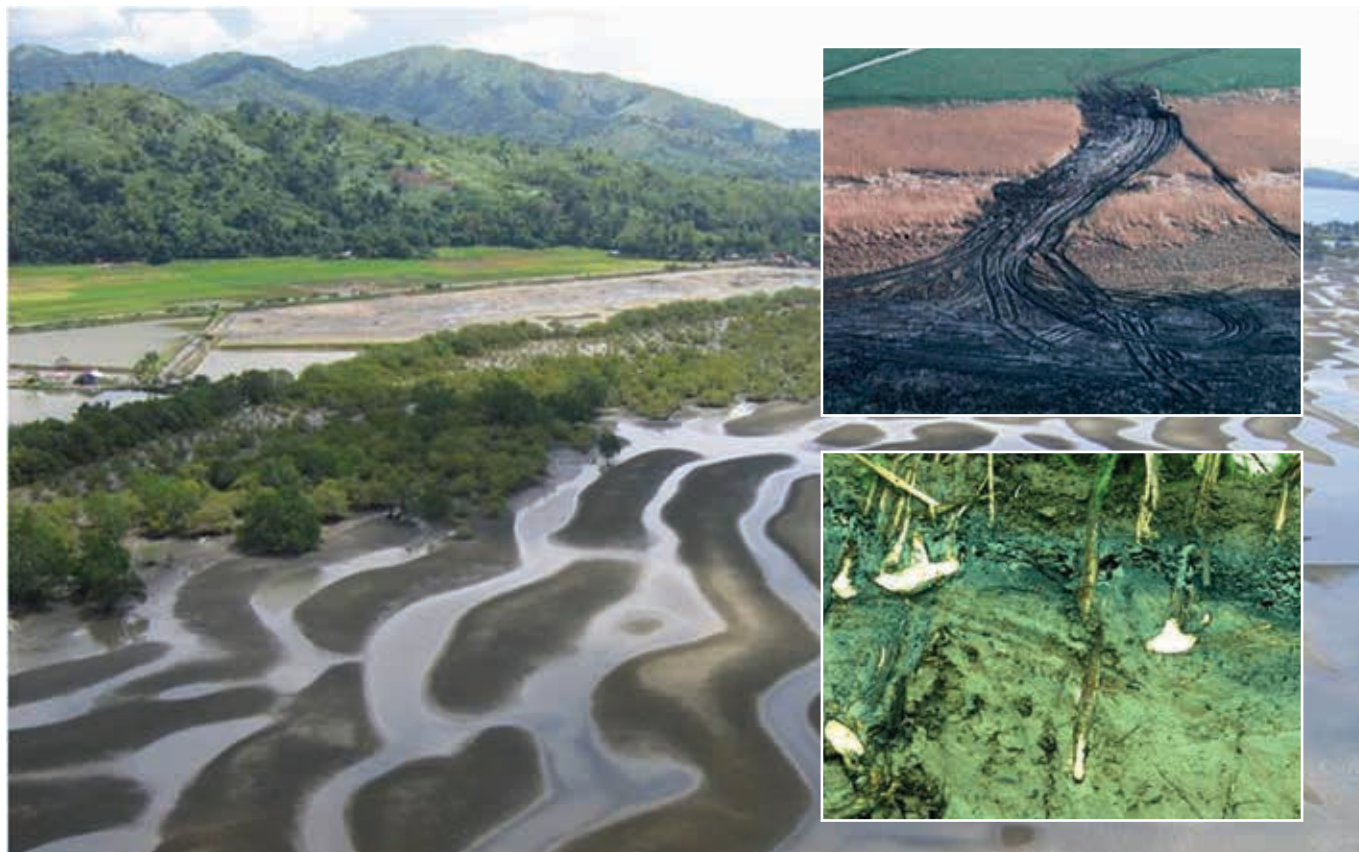
▲ Figura 8: Los sedimentos blandos suelen encontrarse a lo largo de franjas costeras protegidas y menos dinámicas, y normalmente son muy productivas biológicamente. Debe considerarse no actuar y permitir la limpieza natural de una marisma contaminada, ya que las operaciones de limpieza podrían ampliar y agravar el daño. Los hidrocarburos que penetren en el sustrato, tal y como se ilustra en la muestra transversal, pueden permanecer allí durante años.