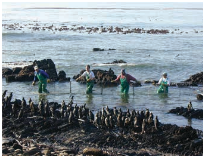
▲ Figura 3: confinamiento de pingüinos africanos (Spheniscus demersus) contaminados.