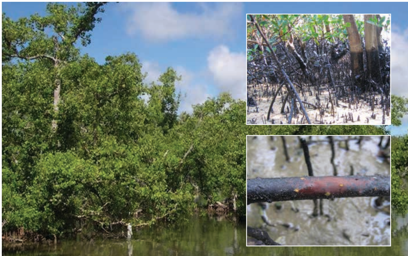
▲ Figura 9: los manglares son muy vulnerables a los hidrocarburos. El recubrimiento de raíces fúlcreas o neumatóforas (estructuras respiratorias que crecen verticalmente a través del sustrato) pueden bloquear las lenticelas (poros), lo que impide el intercambio de gases y provoca la asfixia.

sustrato contaminado pueda sustentar nuevos crecimientos (Figura 10). Por ejemplo, la lluvia y las mareas pueden retirar hidrocarburos y a medida que estos se meteorizan, las partículas volátiles se evaporan y permanecen hidrocarburos residuales con menor toxicidad.